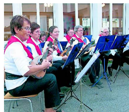
In Tessiner-Kluft: das Mandolinorchester Langenthal